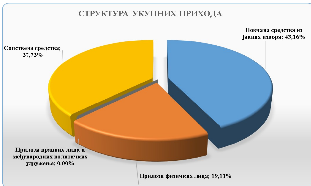
Графикон 1: Структура укупних прихода политичких субјеката у процентима

Политички субјекти су били у обавези да искажу у извештају о трошковима изборне кампање приходе по врстама и то: новчана средства из јавних извора, услуге и добра из јавних извора, прилоге физичких лица политичком субјекту, прилоге правних лица и међународних политичких удружења политичком субјекту и сопствена средства.