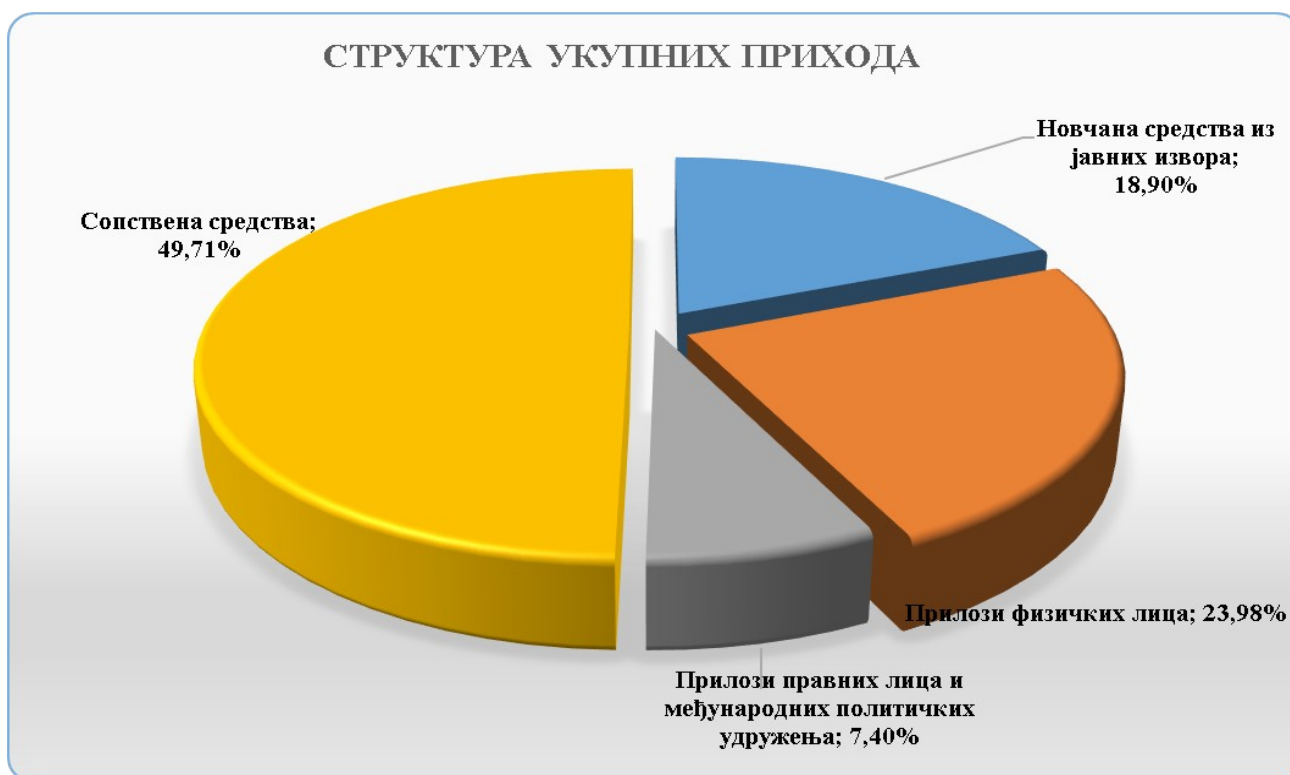
Графикон 1: Структура укупних прихода политичких субјеката у процентима

Политички субјекти су били у обавези да искажу у извештају о трошковима изборне кампање приходе по врстама и то: новчана средства из јавних извора, услуге и добра из јавних извора, прилоге физичких лица политичком субјекту, прилоге правних лица и међународних политичких удружења политичком субјекту, сопствена средства.