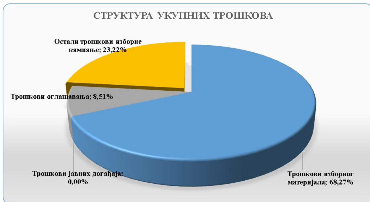
Графикон 2: Структура укупних трошкова политичких субјеката по врстама у процентима

које су политички субјекти исказали у кампањи за 2021. годину износе 1.267.083,45 динара.